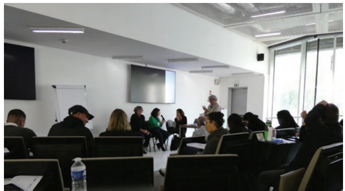
Table Ronde à l'auditorium Georges Perec

Toujours animée par Naïri Nahapétian, la seconde table ronde portée par Makis Solomos, Victoire Dubruel et Hortense Soichet a abordé les possibilités et potentialités pour les communs de modifier les modes de production artistique .