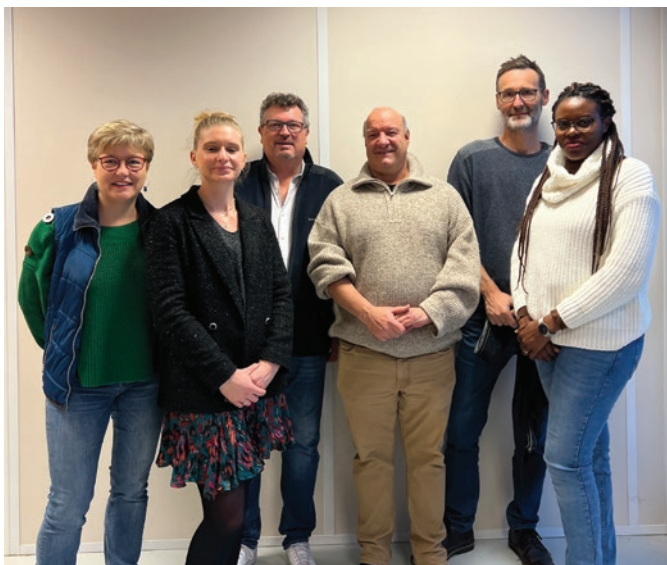
Rentrée des étudiants GOES ► et IESS ▲ à l'IRUP