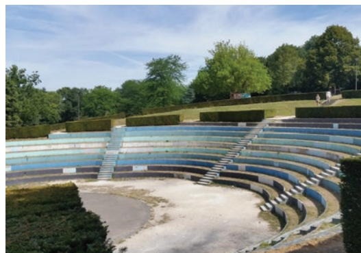
Une partie du théâtre de verdure de Torcy

Objectifs : Aider à la création puis à l'accompagnement d'un collectif pour faire du Théâtre de verdure un lieu de nouveau ouvert à tous. Accompagnement du collectif dans sa démarche de mobilisation des pouvoirs publics et dans la définition des règles de gestion commune.