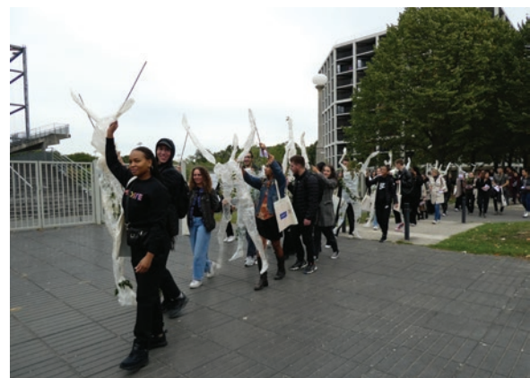
Déambulation artistique des étudiants de licence professionnelle GOESS