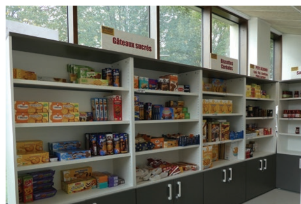
L'épicerie solidaire de Champs-Sur-Marne