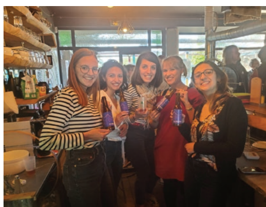
Inauguration de la nouvelle bière La Coopine