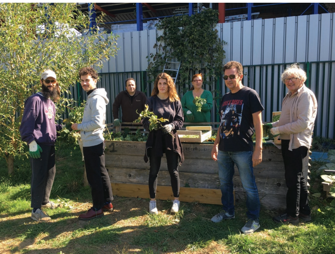
Récolte du Houblon le 19 Septembre à Noisy-le-Grand