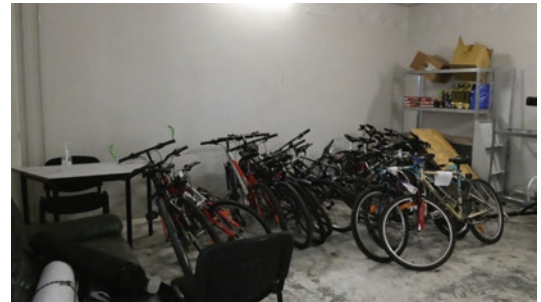
Atelier mobile de réparation vélo

Au terme de la première moitié du festival, les participants assistent sur l'esplanade de Copernic à une session découverte de la vélostation de la M2IE . Cet acteur local engagé en faveur de l'insertion professionnelle est installé sur le campus universitaire depuis 2021. Cette vélostation propose aux étudiants et au personnel de l'université des ateliers participatifs de réparation de vélo.