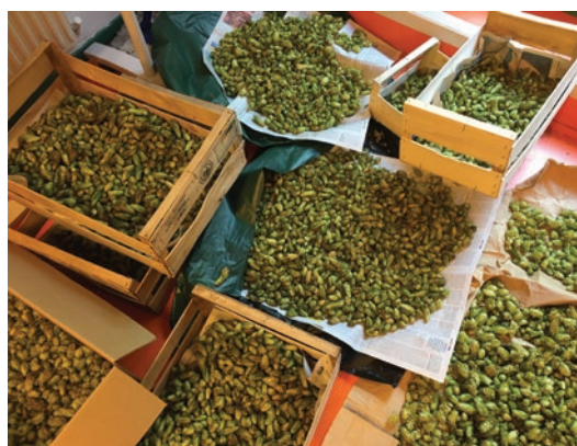
Séchage du Houblon à l'Eco-lieu Georges Braque