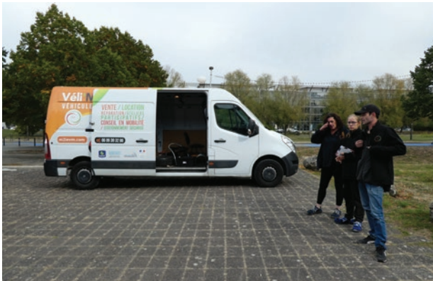
Atelier fixe de réparation vélo à l'université Gustave Eiffel