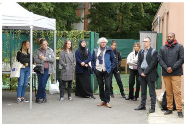
Accueil des participants du festival le 23 septembre

Petit déjeuner, distribution de goodies et discours introductifs démarrent alors le festival.